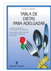
TABLA DE DIETAS PARA ADELGAZAR BIELEFELD, JOCHEN G.