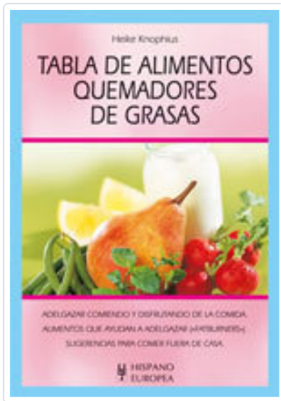
TABLA DE ALIMENTOS QUEMADORES DE GRASAS