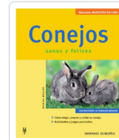
CONEJOS WEGLER, MONIKA