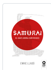
SAMURAI LLADÓ MICHELI, ENRIC