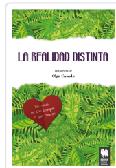
LA REALIDAD DISTINTA CASADO, OLGA