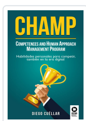
CHAMP CUÉLLAR, DIEGO