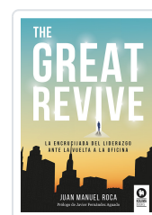
THE GREAT REVIVE ROCA, JUAN MANUEL