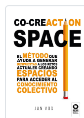
CO-CREATION SPACE VOS, JAN