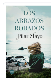
LOS ABRAZOS ROBADOS MAYO, PILAR