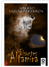
LOS BISONTES DE ALTAMIRA VÁZQUEZ-FIGUEROA, ALBERTO