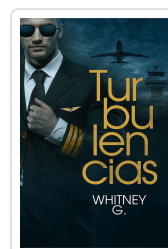
TURBULENCIAS G., WHITNEY