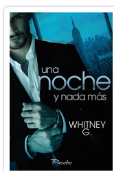
UNA NOCHE Y NADA MÁS G. WHITNEY