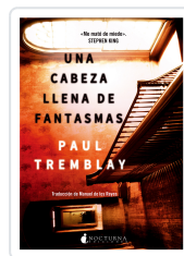
UNA CABEZA LLENA DE FANTASMAS TREMBLAY, PAUL