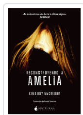
RECONSTRUYENDO A AMELIA MCCREIGHT, KIMBERLY