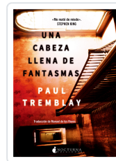
UNA CABEZA LLENA DE FANTASMAS TREMBLAY, PAUL