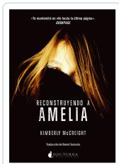
RECONSTRUYENDO A AMELIA MCCREIGHT, KIMBERLY