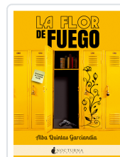
LA FLOR DE FUEGO QUINTAS GARCÍANDIA, ALBA