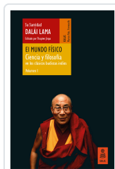
EL MUNDO FÍSICO (CIENCIA Y FILOSOFÍA EN LOS CLÁSICOS BUDISTAS INDIOS, VOL. 1) LAMA, DALÁI