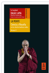
LA MENTE (CIENCIA Y FILOSOFÍA EN LOS CLÁSICOS BUDISTAS INDIOS, VOL. II) LAMA, DALÁI