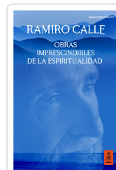
OBRAS IMPRESCINDIBLES DE LA ESPIRITUALIDAD CALLE CAPILLA, RAMIRO