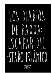
LOS DIARIOS DE RAQQA: ESCAPAR DEL ESTADO ISLÁMICO SAMER