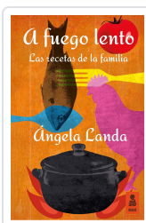
A FUEGO LENTO LANDA APARICIO, ÁNGELA