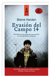
EVASIÓN DEL CAMPO 14 (5ª ED.) HARDEN, BLAINE