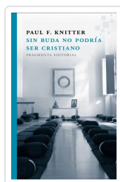
SIN BUDA NO PODRÍA SER CRISTIANO KNITTER, PAUL F.