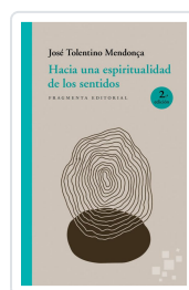
HACIA UNA ESPIRITUALIDAD DE LOS SENTIDOS TOLENTINO MENDONÇA, JOSÉ