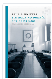
SIN BUDA NO PODRÍA SER CRISTIANO KNITTER, PAUL F.