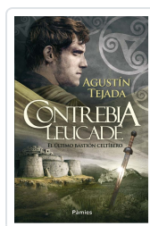
CONTREBIA LEUCADE TEJADA NAVAS, AGUSTÍN