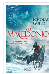
EL MACEDONIO GUILD, NICHOLAS