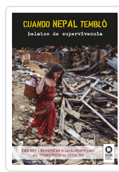
CUANDO NEPAL TEMBLÓ VARIOS AUTORES