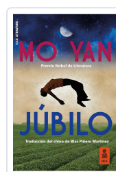
JÚBILO YAN, MO