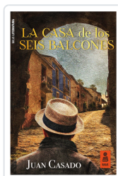
LA CASA DE LOS SEIS BALCONES CASADO FLORES, JUAN