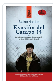
EVASIÓN DEL CAMPO 14 (5ª ED.) HARDEN, BLAINE