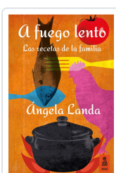
A FUEGO LENTO LANDA APARICIO, ÁNGELA