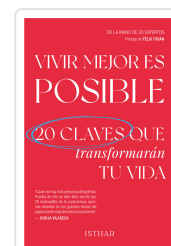
VIVIR MEJOR ES POSIBLE COAUTORIA DE 20 AUTORES