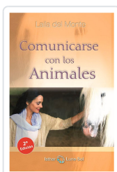
COMUNICARSE CON LOS ANIMALES DEL MONTE, LAILA