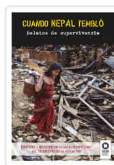
CUANDO NEPAL TEMBLÓ VARIOS AUTORES