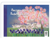
POEMAS DE RUBÉN DARÍO DARÍO, RUBÉN