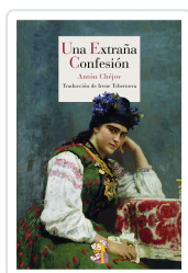
UNA EXTRAÑA CONFESIÓN CHÉJOV, ANTÓN