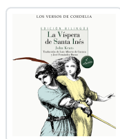
LA VÍSPERA DE SANTA INÉS KEATS, JOHN