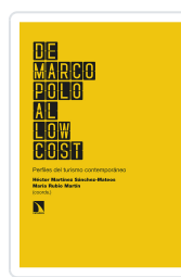
DE MARCO POLO AL LOW COST MARTINEZ SÁNCHEZ-MATEOS, HÉCTOR/RUBIO MARTÍN, MARÍA