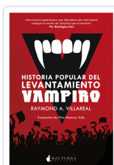
HISTORIA POPULAR DEL LEVANTAMIENTO VAMPIRO VILLAREAL, RAYMOND A.