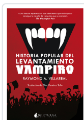
HISTORIA POPULAR DEL LEVANTAMIENTO VAMPIRO VILLAREAL, RAYMOND A.