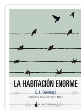
LA HABITACIÓN ENORME CUMMINGS, EDWARD ESTLIN