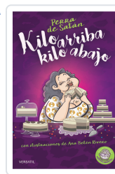
PERRA DE SATÁN, KILO ARRIBA, KILO ABAJO PERRADESATÁN