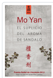
EL SUPICIO DEL AROMA DE SÁNDALO (3ª ED.) YAN, MO