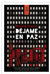
DÉJAME EN PAZ XUECUN, MURONG