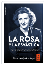
LA ROSA Y LA ESVÁSTICA ASPAS TRAVER, FRANCISCO JAVIER