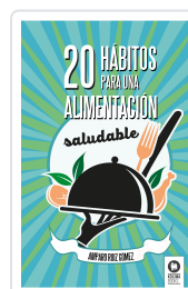
20 HÁBITOS PARA UNA ALIMENTACIÓN SALUDABLE RUÍZ GÓMEZ, AMPARO