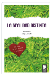
LA REALIDAD DISTINTA CASADO, OLGA