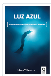
LUZ AZUL VILLANUEVA TOMAS, ULYSES