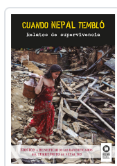
CUANDO NEPAL TEMBLÓ VARIOS AUTORES