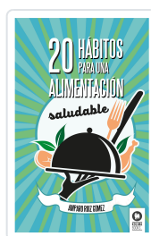
20 HÁBITOS PARA UNA ALIMENTACIÓN SALUDABLE RUIZ GÓMEZ, AMPARO