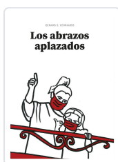
LOS ABRAZOS APLAZADOS S. FERRANDO, GERARD