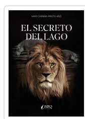
EL SECRETO DEL LAGO PRIETO AÑO, MARI CARMEN