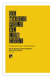
DE MARCO POLO AL LOW COST MARTÍNEZ SÁNCHEZ- MATEOS, HÉCTOR/RUBIO MARTÍN, MARÍA