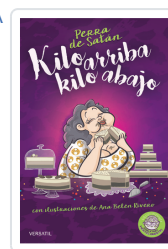
PERRA DE SATÁN, KILO ARRIBA, KILO ABAJO PERRADESATÁN