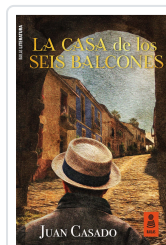
LA CASA DE LOS SEIS BALCONES CASADO FLORES, JUAN