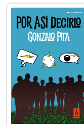
POR ASÍ DECIRLO PITA, GONZALO