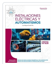
INSTALACIONES ELÉCTRICAS Y AUTOMATISMOS 2.ª EDICIÓN 2025 CERDÁ FILIU, LUIS MIGUEL