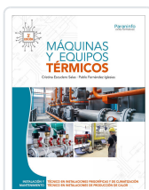
MAQUINAS Y EQUIPOS TÉRMICOS 3.ª EDICIÓN 2025 ESCUDERO SALAS, CRISTINA ; FERNANDEZ IGLESIAS, PABLO