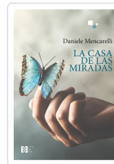
LA CASA DE LAS MIRADAS DANIELE MENCARELLI