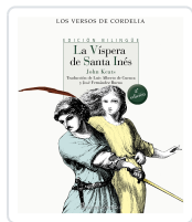
LA VÍSPERA DE SANTA INÉS KEATS, JOHN