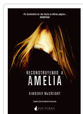
RECONSTRUYENDO A AMELIA MCCREIGHT, KIMBERLY