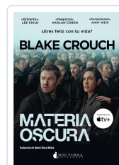
MATERIA OSCURA CROUCH, BLAKE