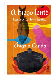
A FUEGO LENTO LANDA APARICIO, ÁNGELA