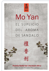
EL SUPICIO DEL AROMA DE SÁNDALO (3ª ED.) YAN, MO