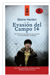
EVASIÓN DEL CAMPO 14 (5ª ED.) HARDEN, BLAINE