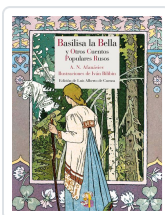
BASILISA LA BELLA Y OTROS CUENTOS POPULARES RUSOS AFANÁSIEV, ALEKSANDR NIKOLÁYEVICH