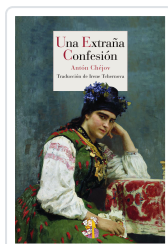
UNA EXTRAÑA CONFESIÓN CHÉJOV, ANTÓN