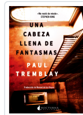
UNA CABEZA LLENA DE FANTASMAS TREMBLAY, PAUL